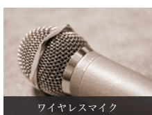
ワイヤレスマイク