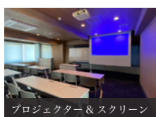
プロジェクター & スクリーン