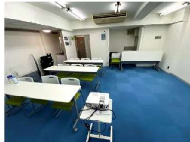
実際の室内 (原状回復)